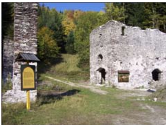
Šachta Ludovika - inštalované info-tabuľe