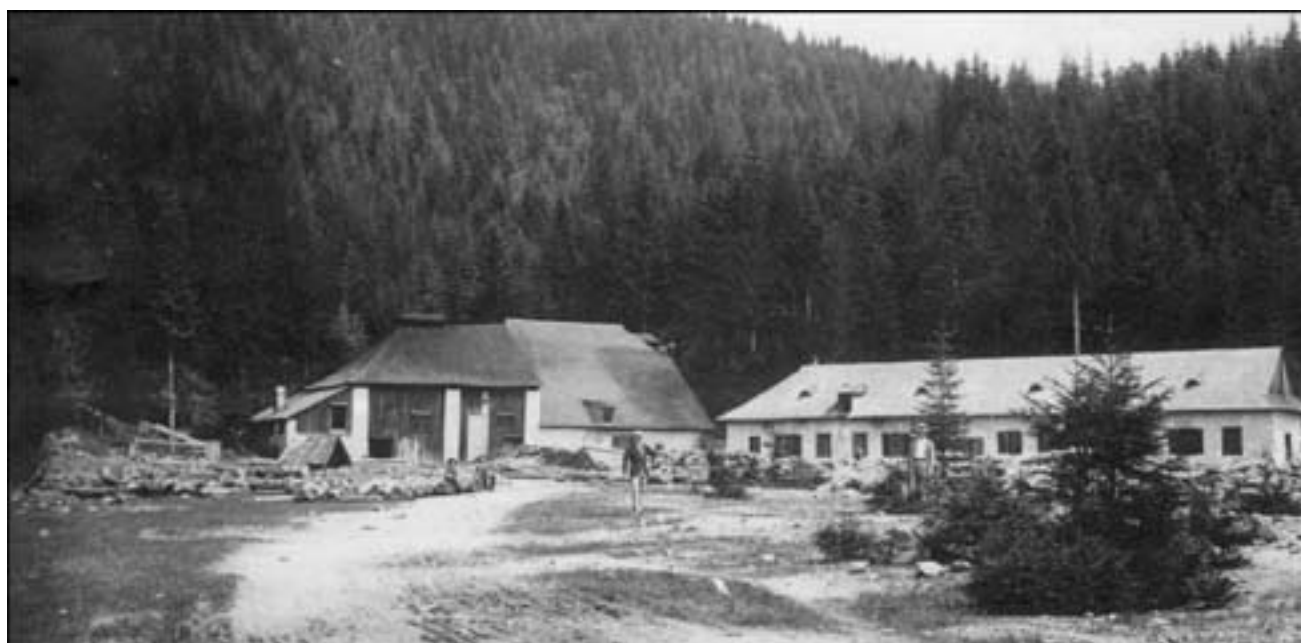
Zachovaná fotografia šachty Ludovika zo začiatku 20. storočia

Z pridelených finančných prostriedkov bolo možné zrealizovať len záchranu stojaceho muriva stien strojovne. Bol zakonzervovaný vrch múrov tak, aby sa zabránilo ďalšiemu zvetrávaniu. Dno strojovne bolo vyčistené od napadaných skál a zeminy popri stenách strojovne a vypílený náletový porast vo vnútri, na múroch, v ústí žlabu a v okolí šachty. Kamenné murivo stavby je ešte stále v relatívne dobrom stave sú zachované všetky obvodové múry. Drevené podlahy, stropy a strecha sa žiaľ nezachovali.