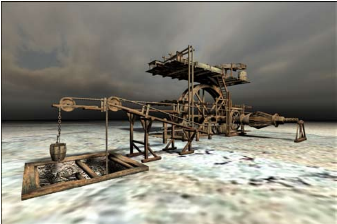
Vizualizácia drevených častí objektu s ťažným strojom (autor J. Scholtz ml.)