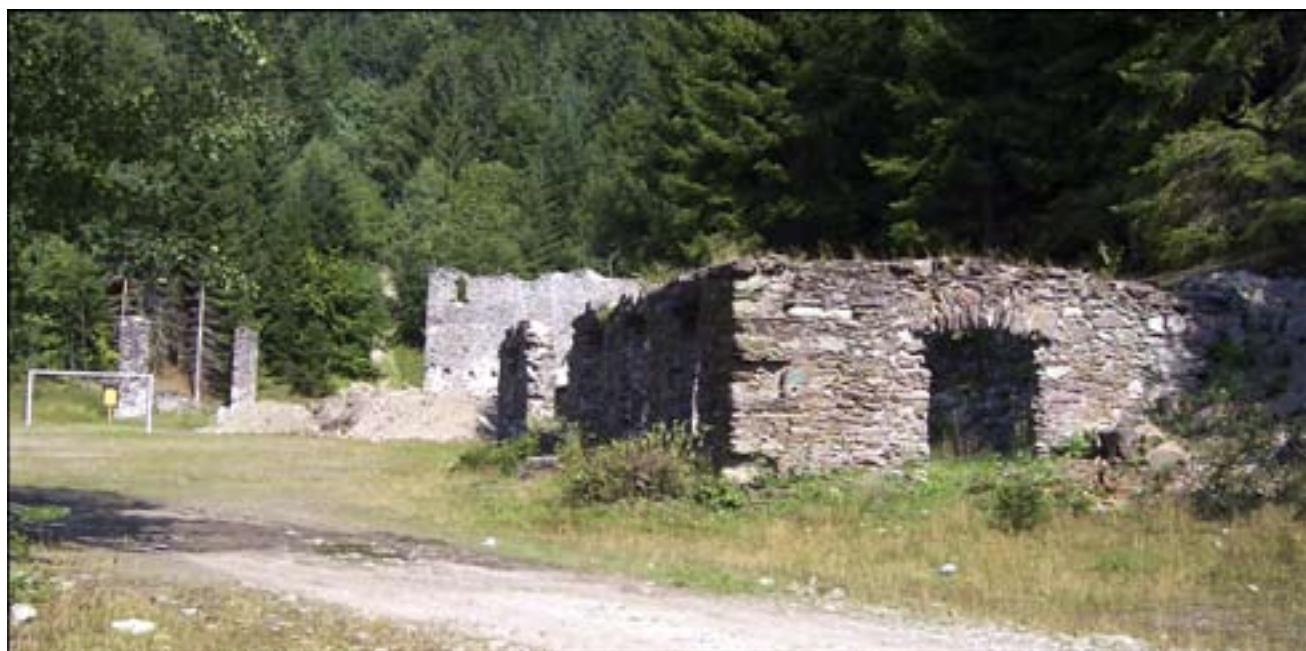
Objekt „administratívnej“ budovy, v pozadí strojovňa a šachta

Priestor šachty Ludovika by sa tak určite stal reprezentačný priestor s dychom histórie pre usporadúvanie väčších kultúrnych a športových podujatí (historická „Tekvicová zábava“, každoročný futbalový turnaj o Pohár Španej Doliny ...)