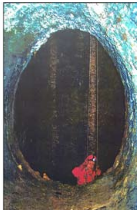
Pohľada do vodnej štólne zo strany strojovne naspäť do šachty