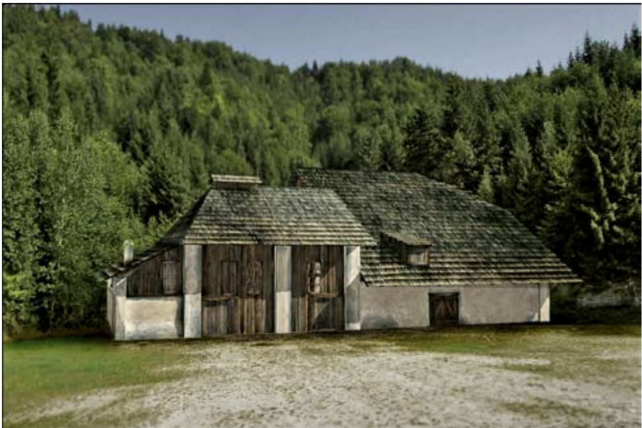
Vizualizácia zrekonštruovaného objektu strojovne a šachty (autor J. Scholtz ml.)