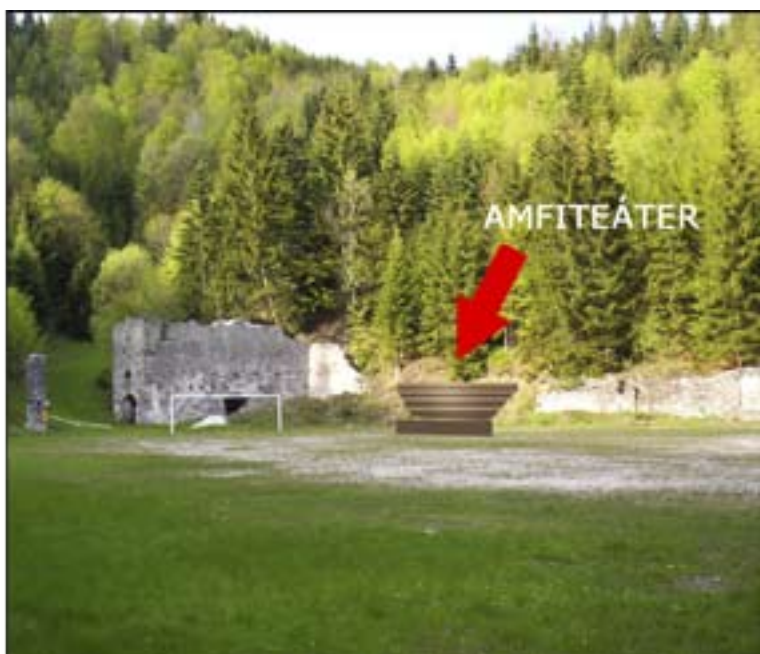
Navrhovaný amfiteáter (sedenie inštalované vo svahu)