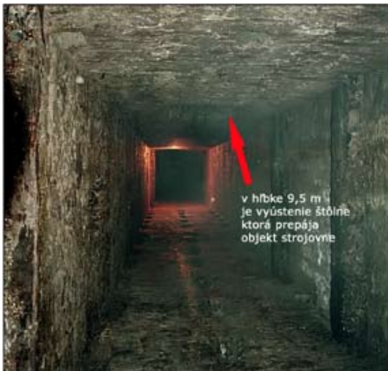
Pohľad do šachty s vyústením vodnej štólne

Podrobný technický popis realizácie je uvedený v záverečnej správe: ŠPANIA DOLINA - ŠACHTA LUDOVÍKA - PRIESKUM MOŽNOSTÍ SPRÍSTUPNENIA ENVIGEO, a.s.(Kynceľová 2, 97411 Banská Bystrica, september 2005).