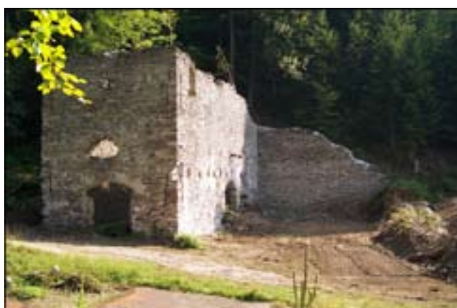
Takto to je