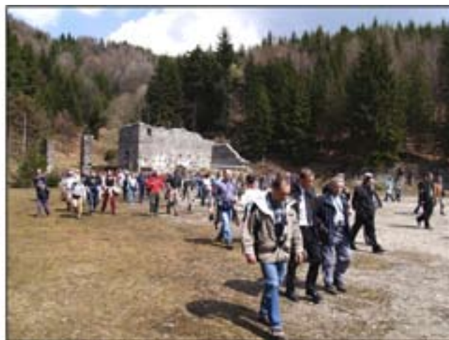
Šachte Ludovika - otvorenie banského chodníka